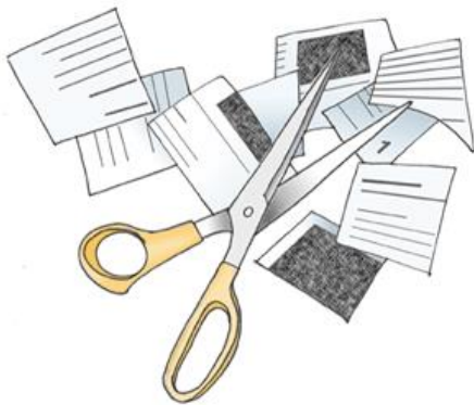
Abbildung 2: Wie wird plagiiert? (Weber-Wulff, 2004b)

Das im Kurzbeleg genannte Werk muss im Literaturverzeichnis aufgeführt werden.